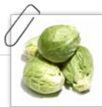
Chou de Bruxelles