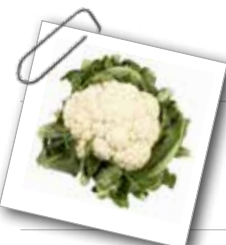
Chou de fleur