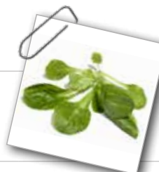
Salade de blé